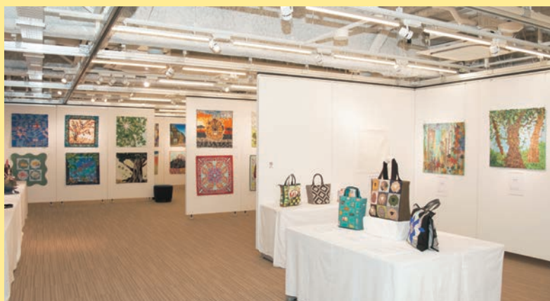
前回の様子。

誌面では見られない入選作品も展示し、また様々な素材や素晴らしいテクニックなど、実物を間近でご覧いただけます。