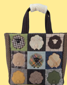
B部門 金賞受賞 『羊のウールトートバッグ』 伊達久美子