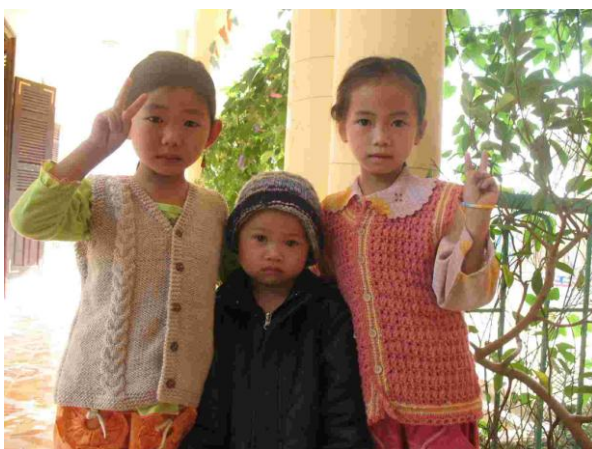
寄付されたベストを着た女の子たち