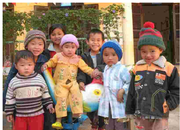
毛糸の帽子をかぶった子どもたち