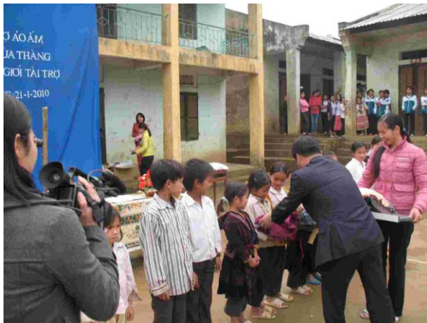
セーター贈呈式の様子②