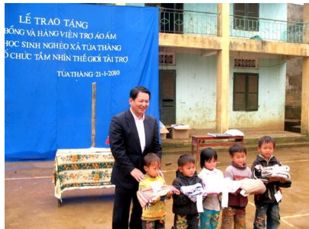
セーター贈呈式の様子③