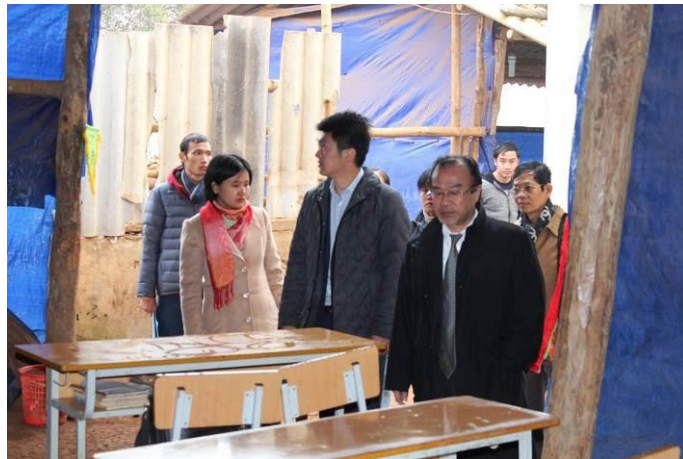
学校施設の状況を視察する三井住友ベトナム法人の関係者の方々