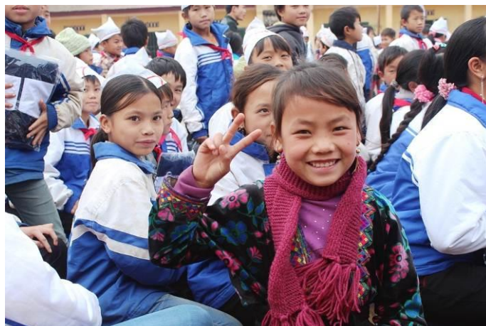
マフラーを受け取り喜ぶ子ども