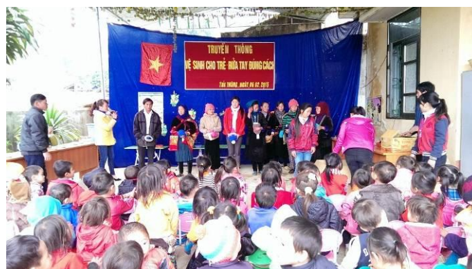
贈呈式に集まった子どもたちや学校関係者