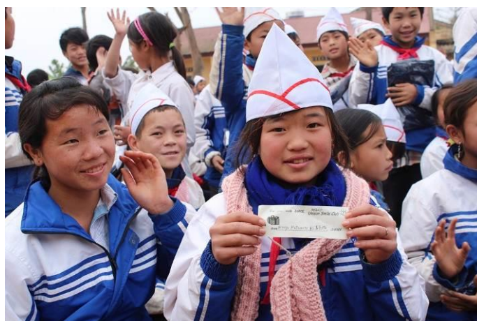
ご支援者様のお名前の書かれたマフラーを手にして喜ぶ子ども