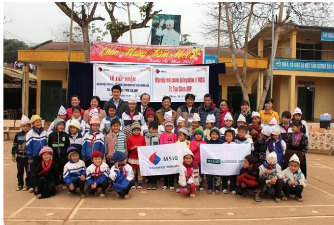
贈呈式に参加した子どもたちと出席した三井住友ベトナム法人及び人民委員会関係者