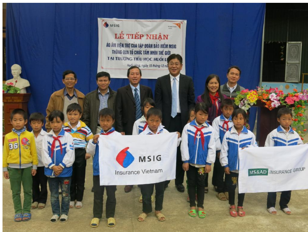
寄贈を受けた子どもたちと三井住友ベトナム法人、学校及び人民委員会関係者の方々