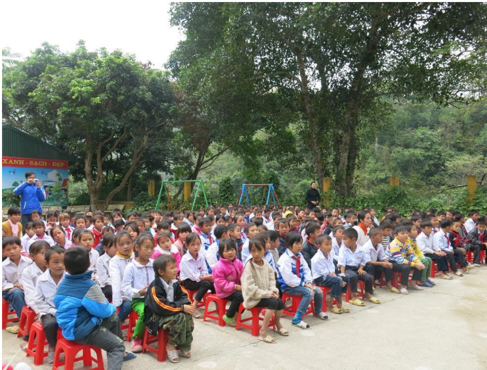
贈呈式に集まった子どもたち