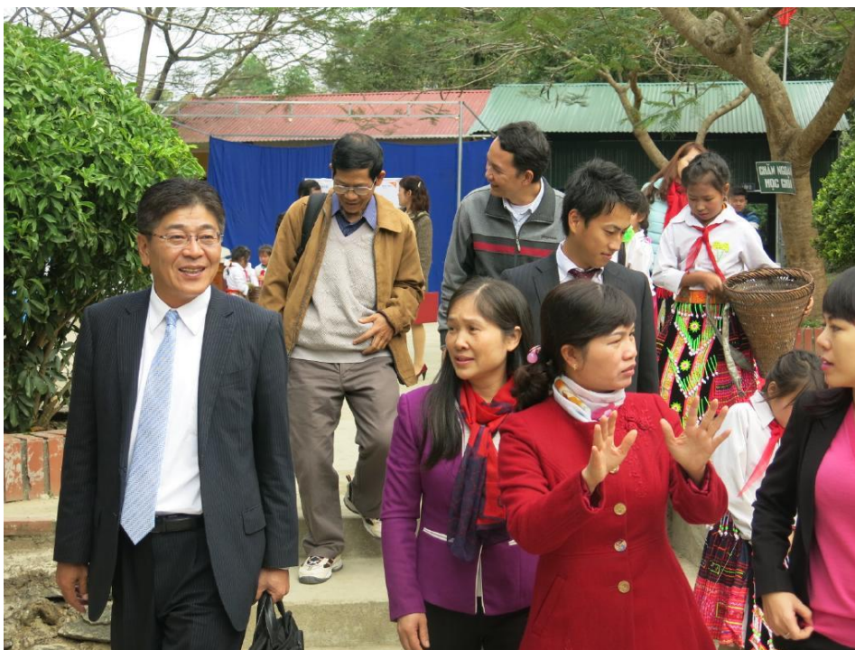
学校施設の状況を視察する三井住友ベトナム法人の関係者の方々