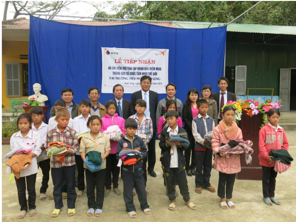
寄贈を受けた子どもたちと三井住友ベトナム法人、学校及び人民委員会関係者の方々