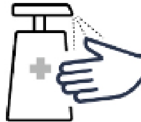
手の消毒 Disinfecting fingers