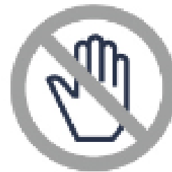
さわらないでください Don't touch