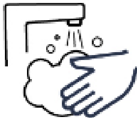
こまめに手洗い Hand wash frequently