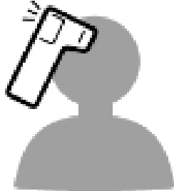
入館時の検温 Temperature measurement