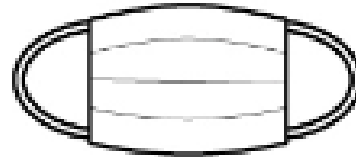
マスク着用 Wearing a mask