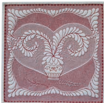
2017年 「Bouquet of Feather」