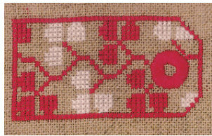
本誌 5 ページ掲載